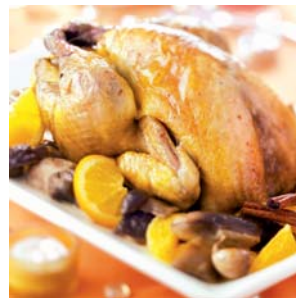
© Volailles Fermières Label Rouge "Chapon de Pintade Label Rouge rôti aux cèpes, parfumé à l'orange"

Tous ces critères sont contrôlés régulièrement par des organismes certificateurs. Le Label Rouge, attribué et supervisé, par le Ministère de l'Agriculture, constitue une garantie officielle de qualité supérieure et également une véritable différenciation en termes de goût et d'éthique de production.